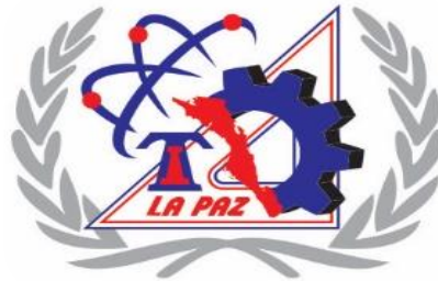
Figura 1: Título de lo que representa la figura